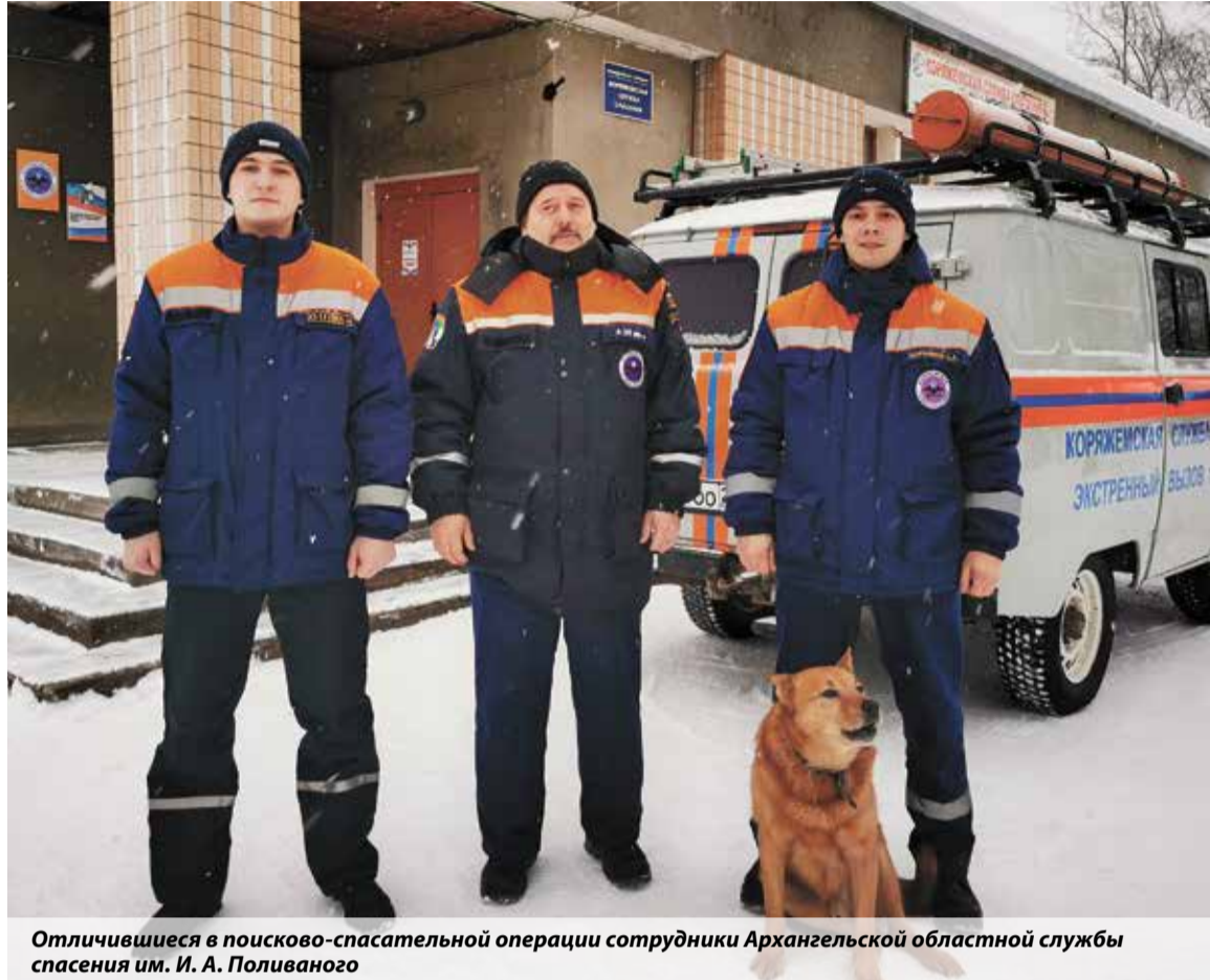
Отличившиеся в поисково-спасательной операции сотрудники Архангельской областной службы спасения им. И. А. Поливаного

И оператор службы спасения сумел за короткий срок совершить буквально невозможное. Он объяснил собеседнику, как тот может найти свои географические коор-