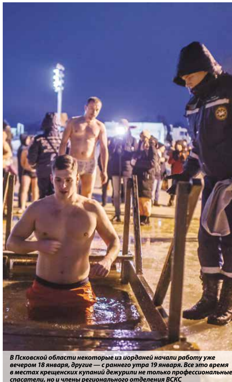
В Псковской области некоторые из иорданей начали работу уже вечером 18 января, другие — с раннего утра 19 января. Все это время в местах крещенских купаний дежурили не только профессиональные спасатели, но и члены регионального отделения ВКС