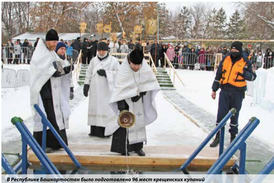
В Республике Башкортостан было подготовлено 96 мест крещенских купаний

Православные верующие отметили Богоявление, или Крещение Господне, традиционными купаниями. Безопасность праздника, начиная с этапа подготовки к нему, находилась на контроле сотрудников МЧС России