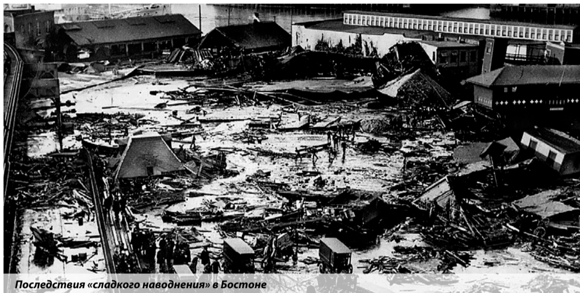
Последствия «сладкого наводнения» в Бостоне

Владимир Другак