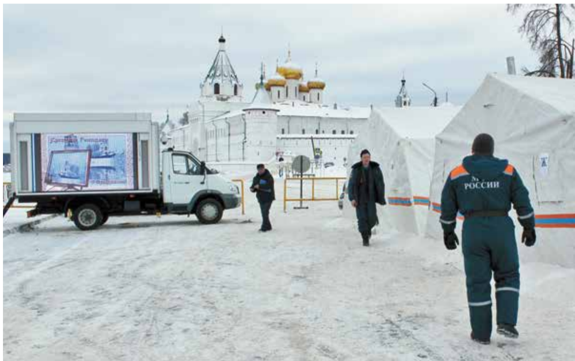
В Костромской области в этом году организовано 24 купели, из них 6 закрытых на территории храмов