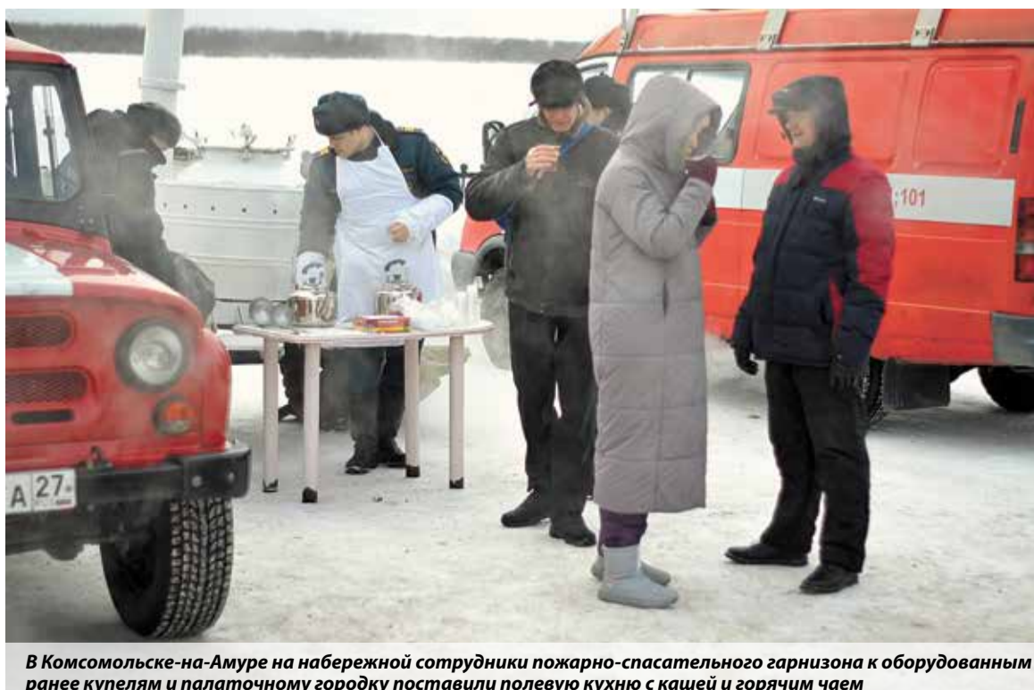
В Комсомольске-на-Амуре на набережной сотрудники пожарно-спасательного гарнизона к оборудованным ранее купелям и палаточному городку поставили полевую кухню с кашей и горячим чаем