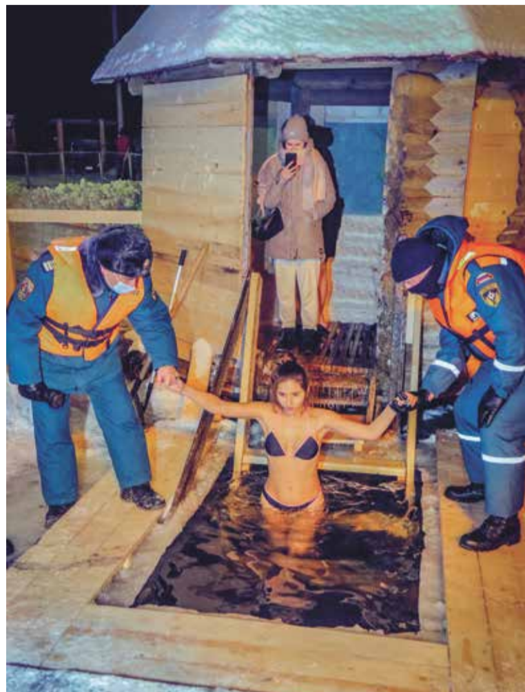
В Смоленской области в Крещенскую ночь искупалось около 2000 человек, в числе которых были мужчины и женщины, подростки и пожилые люди. Дежурство личного состава, обеспечивающего безопасность, организовано до конца мероприятий